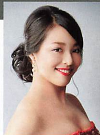
メゾソプラノ 山下裕賀